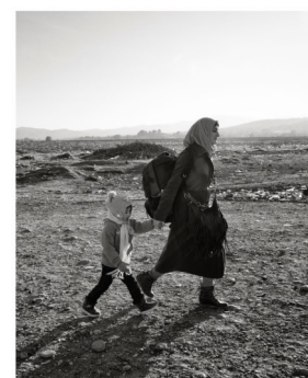
WOMEN REFUGEES AND ASYLUM SEEKERS IN THE EU INTERNATIONAL WOMEN'S DAY 2016